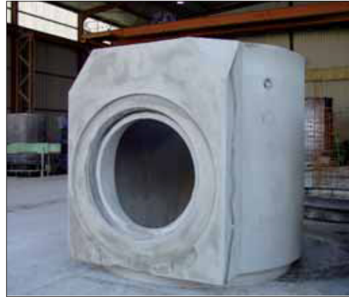
Type B / Type B